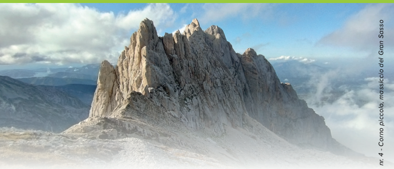
nr. 4 - Corno piccolo, massiccio del Gran Sasso